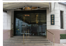
学士会館撞球室 キャロム中台4台 大台2台