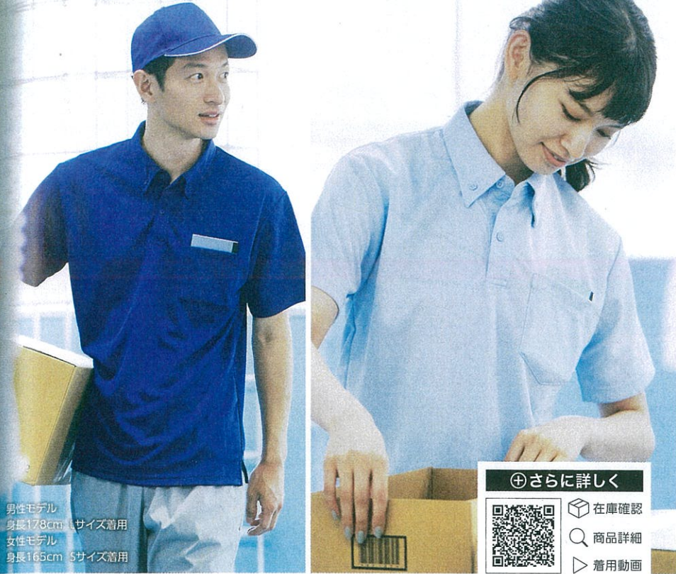
男性モデル 身長178cm Lサイズ着用 女性モデル 身長165cm Sサイズ着用